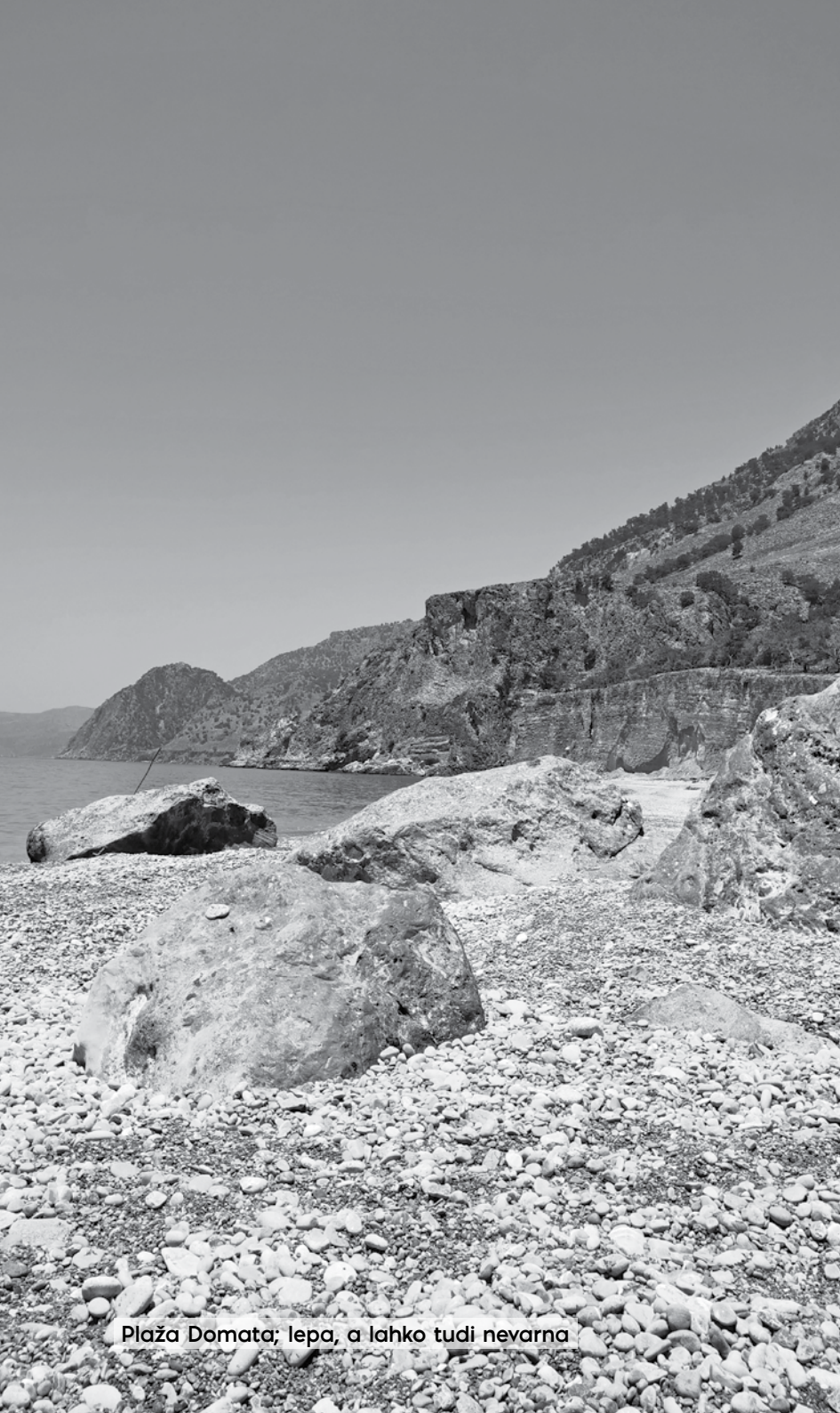
Plaža Domata; lepa, a lahko tudi nevarna